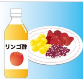
フルーツは冷凍のものでもOK!りんご酢をベースにすると、より飲みやすく仕上がります

好みのかき氷シロップでつくってみるのも良いですね!また、缶詰のサランポを添えれば、より喫茶店っぽくなりますよ!