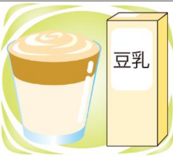
牛乳を豆乳に変えても美味しいですよ!

カレー屋さんなどでなじみのラッシーもつくれます!用意するのは、ヨーグルト、牛乳、はちみつ。ヨーグルトと牛乳は同量が目安ですが、お好みで調整してくださいね。ヨーグルトと牛乳とはちみつをミキサーに入れて混ぜるだけ!お好みで水を混ぜてシャリシャリの食感を楽しんだり、ブルーベリーやマンゴーなど、冷凍の果物を加えて混ぜてもおいしくですよ!