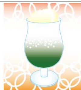
炭酸水をゆっくり注ぐと、見た目にも映える、二層のクリームソーダに!

喫茶店などでいただけるクリームソーダ。おうちでも超手軽につくることができます。用意するのは、かき氷シロップと炭酸水、氷、トッピングのバナナアイス。 氷を入れたグラスに、かき氷シロップをグラスの1/4くらいまで入れ、炭酸水を注ぎます。上にバナナアイスを乗せれば完成です。 メジャーなのはメロンソーダですが、いちご、ブルーハワイなど、お