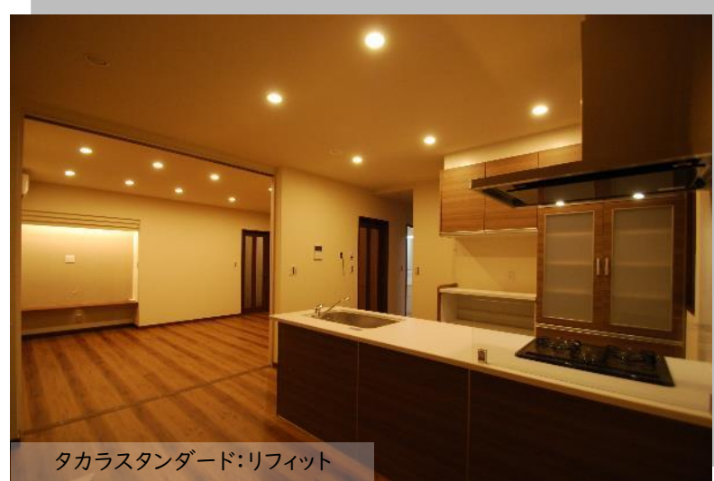
タカラスタンダード:リフィット

読書家のご主人の為、納戸をウォークインクローゼットと書斎に変更。大容量の本棚を造り付けました。明るさもTPOに合わせてコントロール